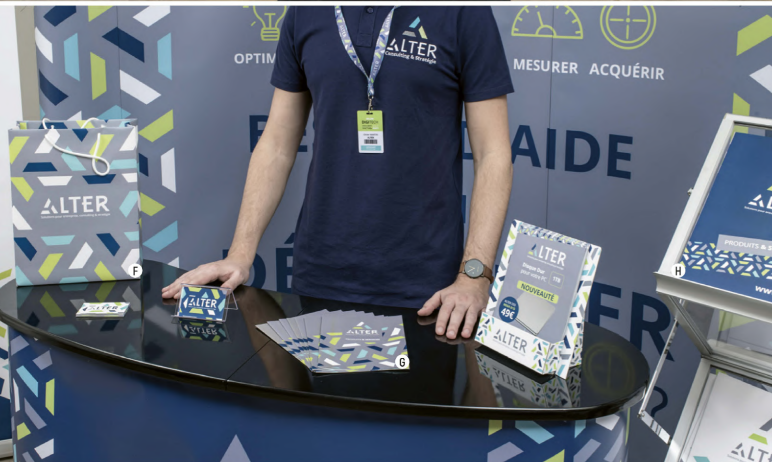
A Roll-up B Stand parapluie courbe C Stand d'accueil D Tapis de sol personnalisé E Totem tubulaire F Sac prestige G Dépliant 1 pli central H Porte brochure